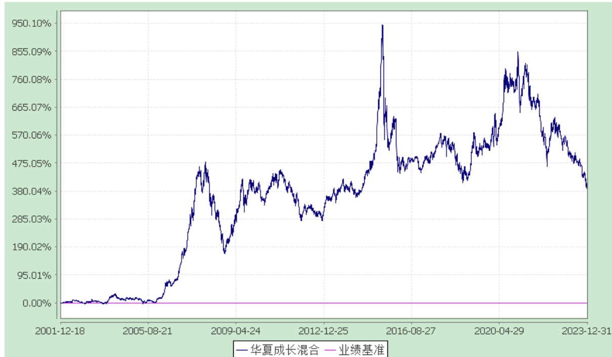
份额累计净值增长率与业绩比较基准收益率历史走势对比图 (2001年12月18日至2023年12月31日)