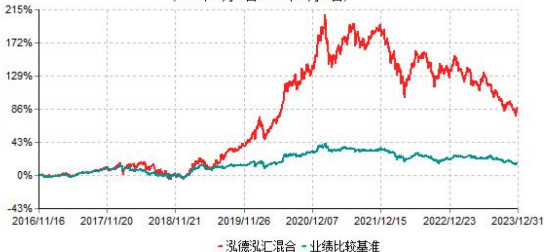
泓德泓汇灵活配置混合型证券投资基金累计净值增长率与业绩比较基准收益率历史走势对比图 (2016年11月16日-2023年12月31日)

注：根据基金合同的约定，本基金建仓期为6个月，截至报告期末，本基金的各项投资比例符合基金合同关于投资范围及投资限制规定。