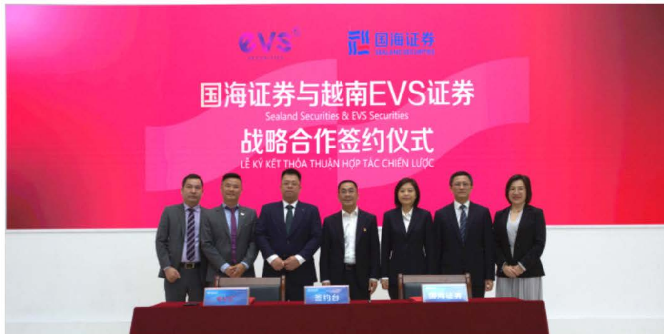
与越南EVS证券公司签署战略合作协议