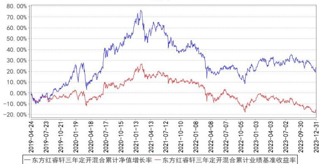
东方红睿轩三年定开混合累计净值增长率与同期业绩比较基准收益率的历史走势对比图