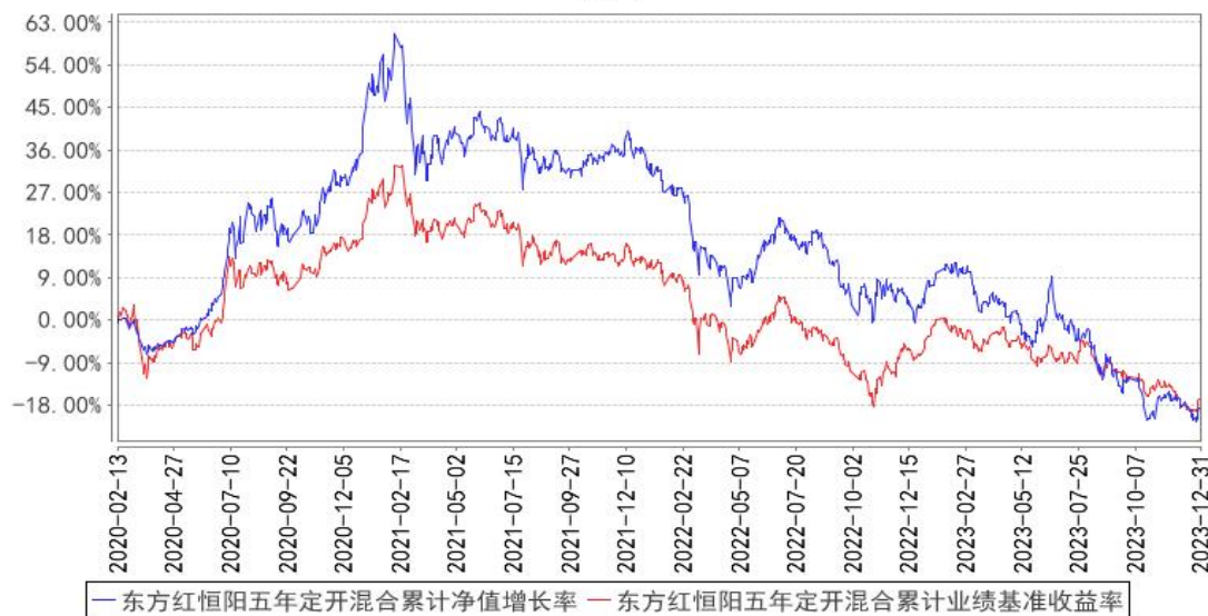
东方红恒阳五年定开混合累计净值增长率与同期业绩比较基准收益率的历史走势对比图