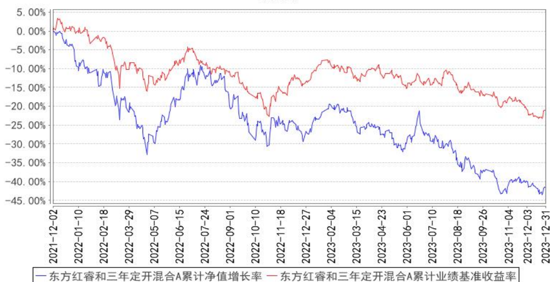
东方红睿和三年定开混合A累计净值增长率与同期业绩比较基准收益率的历史走势对比图