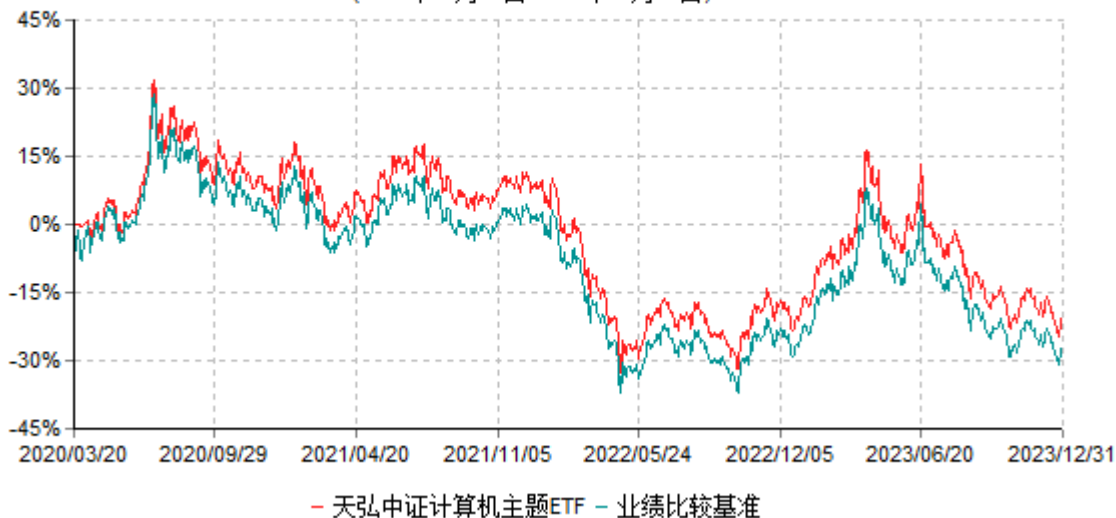
天弘中证计算机主题交易型开放式指数证券投资基金累计净值增长率与业绩比较基准收益率 历史走势对比图 (2020年03月20日-2023年12月31日)

注：1、本基金合同于2020年03月20日生效。 2、本报告期内，本基金的各项投资比例达到基金合同约定的各项比例要求。