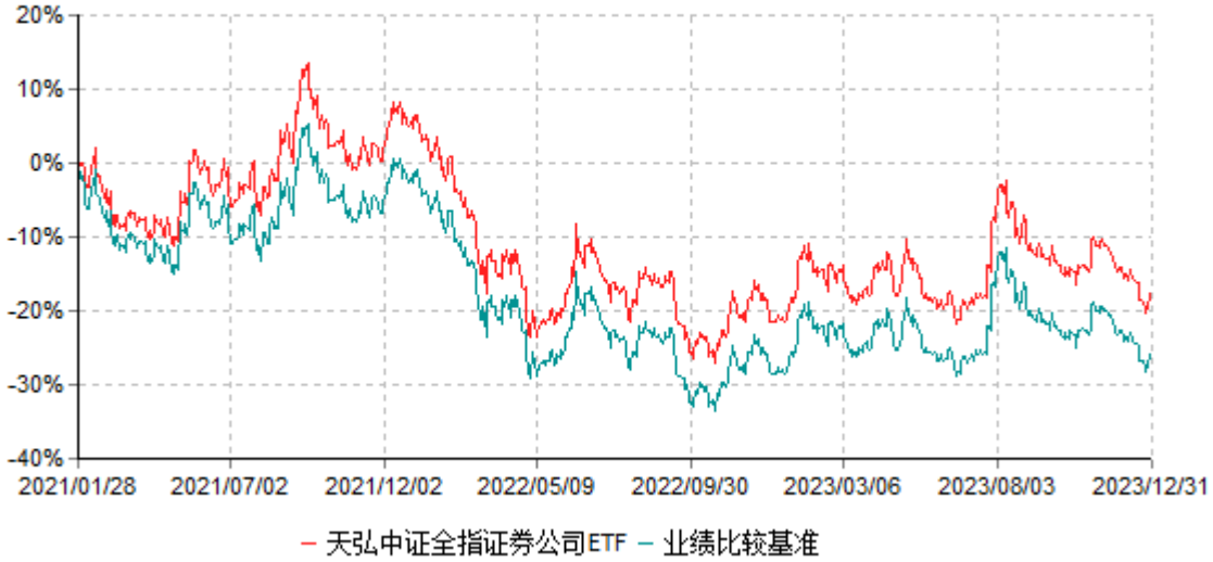
天弘中证全指证券公司交易型开放式指数证券投资基金累计净值增长率与业绩比较基准收益率历史走势对比图 (2021年01月28日-2023年12月31日)