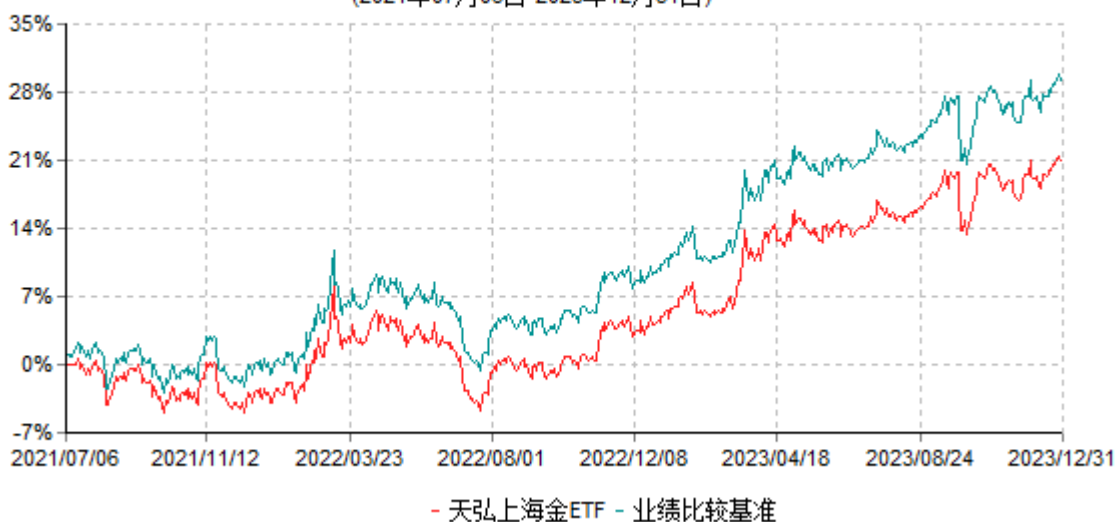
天弘上海金交易型开放式证券投资基金累计净值增长率与业绩比较基准收益率历史走势对比图 (2021年07月06日-2023年12月31日)