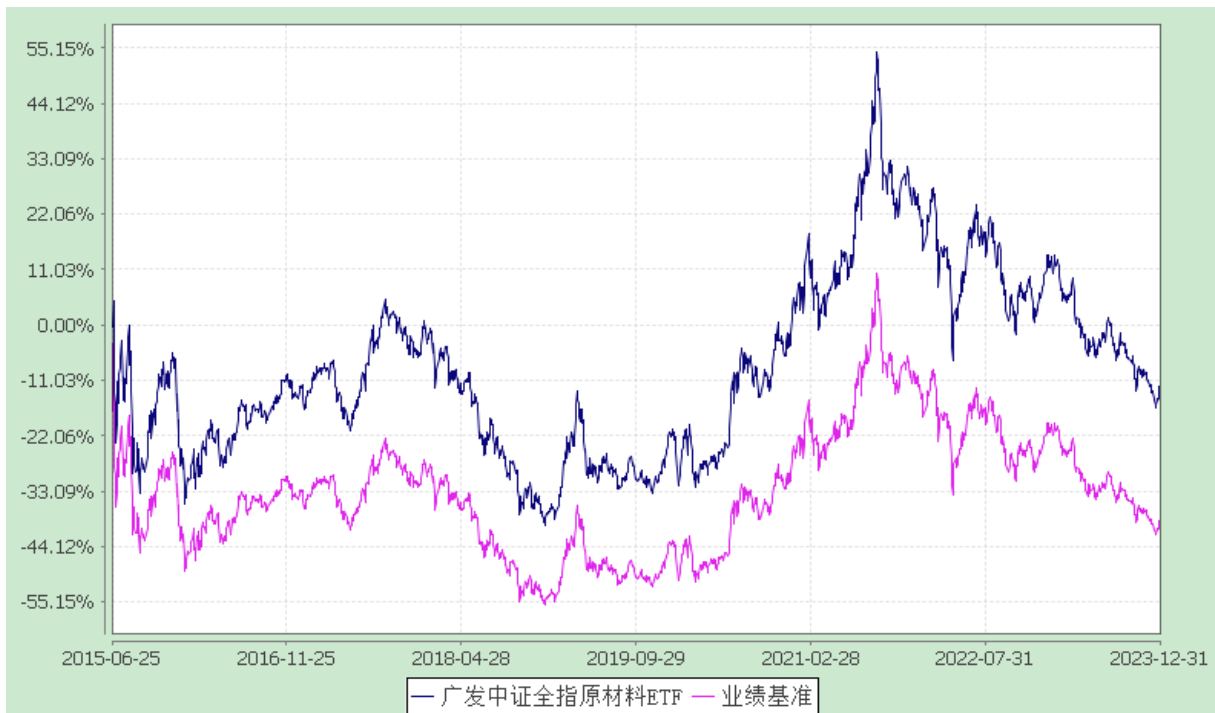
广发中证全指原材料交易型开放式指数证券投资基金 份额累计净值增长率与业绩比较基准收益率的历史走势对比图 (2015年6月25日至2023年12月31日)