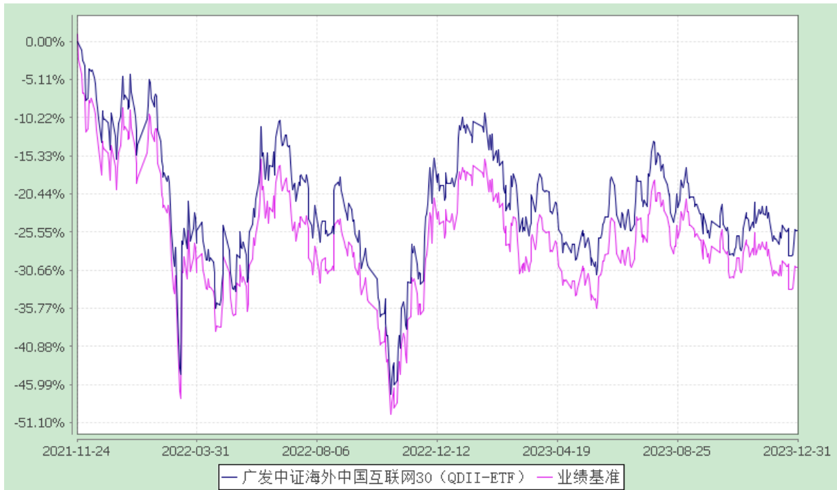
份额累计净值增长率与业绩比较基准收益率历史走势对比图 (2021 年 11 月 24 日至 2023 年 12 月 31 日)