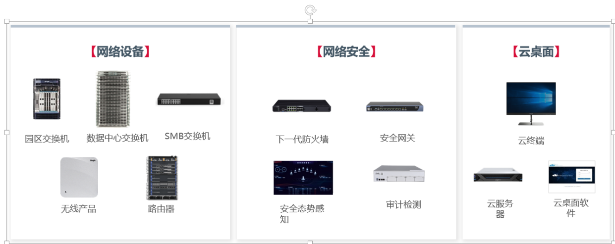
图 2 公司主要产品图示

公司的主要产品包括网络设备（交换机、路由器、无线产品等）、网络安全产品（安全网关、下一代防火墙、安全态势感知等）、云桌面整体解决方案（云服务器、云终端、云桌面软件）以及 IT 运维等其他产品及解决方案等。