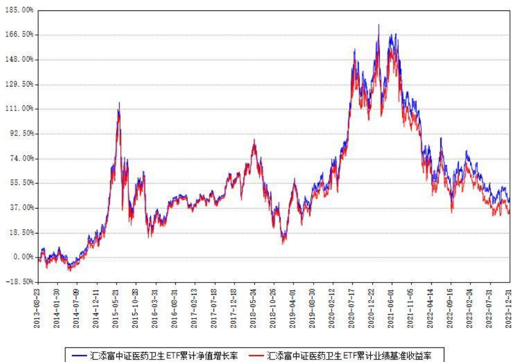
汇添富中证医药卫生ETF累计净值增长率与同期业绩基准收益率对比图

注：本基金建仓期为本《基金合同》生效之日（2013年08月23日）起3个月，建仓期结束时各项资产配置比例符合合同约定。