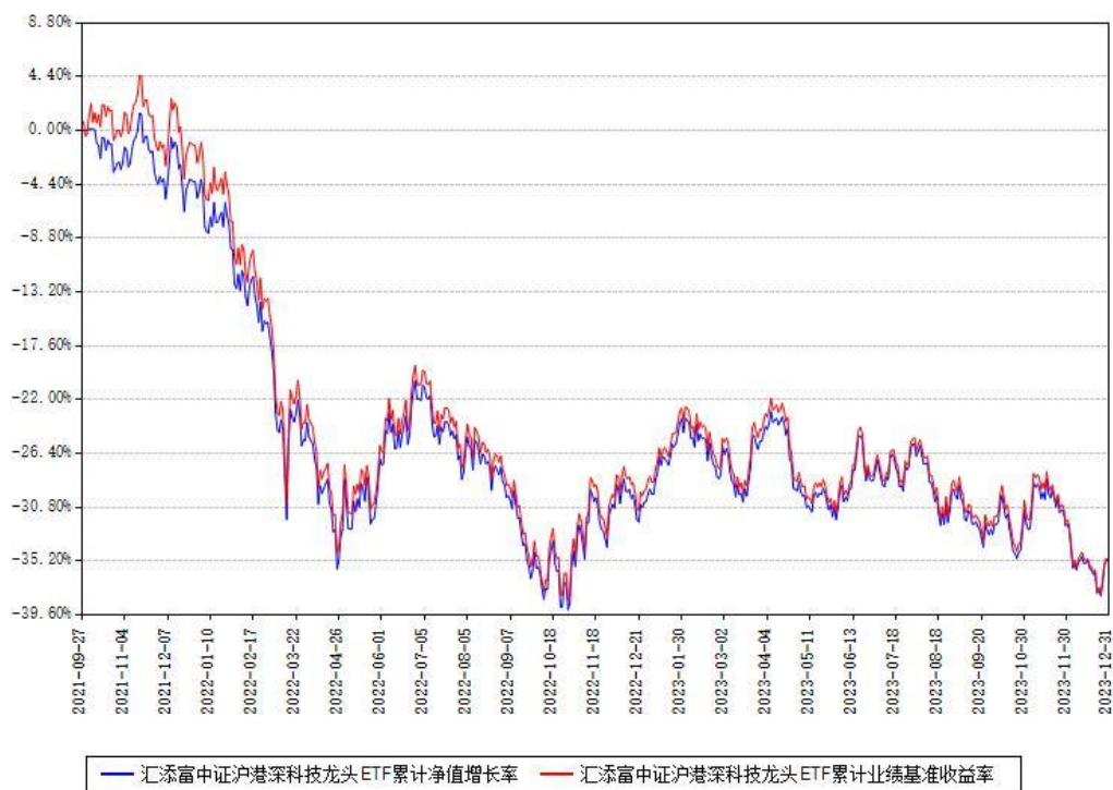
汇添富中证沪港深科技龙头ETF累计净值增长率与同期业绩基准收益率对比图

注：本基金建仓期为本《基金合同》生效之日（2021年09月27日）起6个月，建仓期结束时各项资产配置比例符合合同约定。