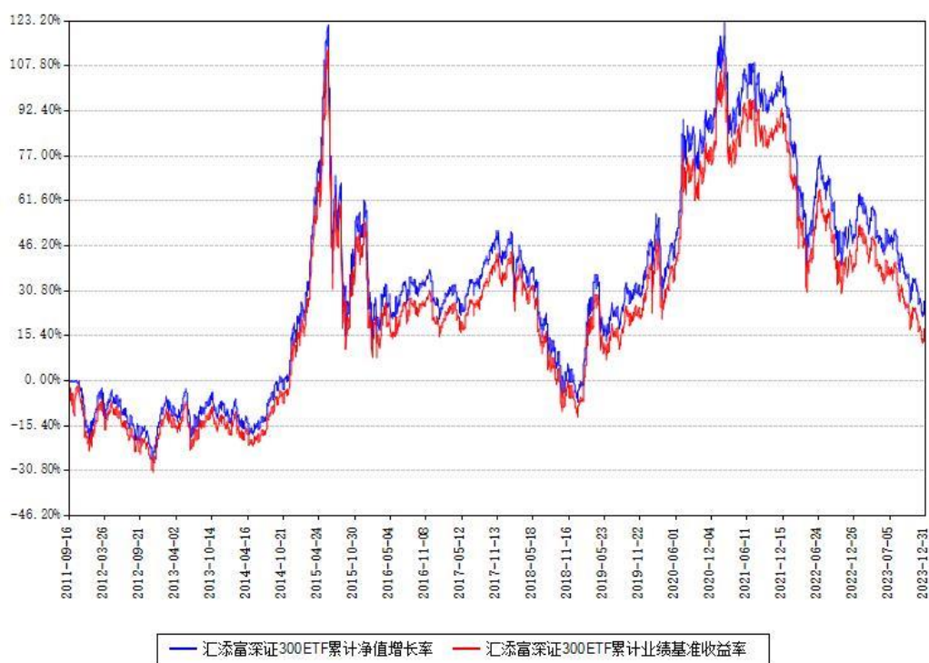
汇添富深证300ETF累计净值增长率与同期业绩基准收益率对比图

注：本基金建仓期为本《基金合同》生效之日（2011年09月16日）起3个月，建仓期结束时各项资产配置比例符合合同约定。