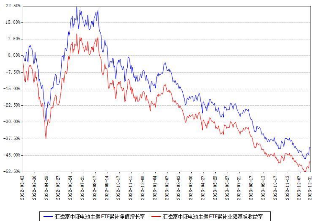
汇添富中证电池主题ETF累计净值增长率与同期业绩基准收益率对比图

注：本基金建仓期为本《基金合同》生效之日（2022年03月03日）起6个月，建仓期结束时各项资产配置比例符合合同约定。