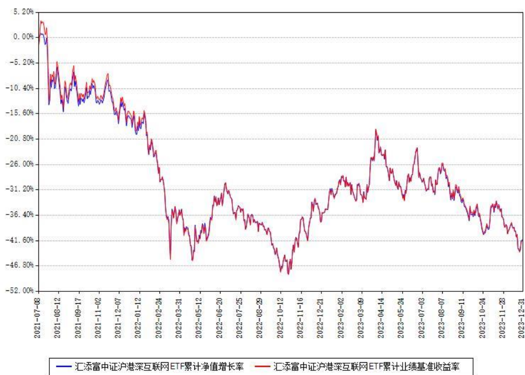
汇添富中证沪港深互联网ETF累计净值增长率与同期业绩比较基准收益率对比图

注：本基金建仓期为本《基金合同》生效之日（2021年07月08日）起6个月，建仓期结束时各项资产配置比例符合合同约定。