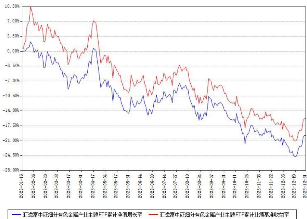
汇添富中证细分有色金属产业主题ETF累计净值增长率与同期业绩基准收益率对比图

注：本《基金合同》生效之日为2023年01月16日，截至本报告期末，基金成立未满一年。本基金建仓期为本《基金合同》生效之日起6个月，截至本报告期末，本基金已完成建仓，建仓期结束时各项资产配置比例符合合同约定。