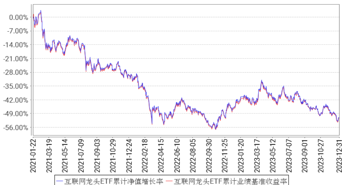
互联网龙头ETF累计净值增长率与同期业绩比较基准收益率的历史走势对比图