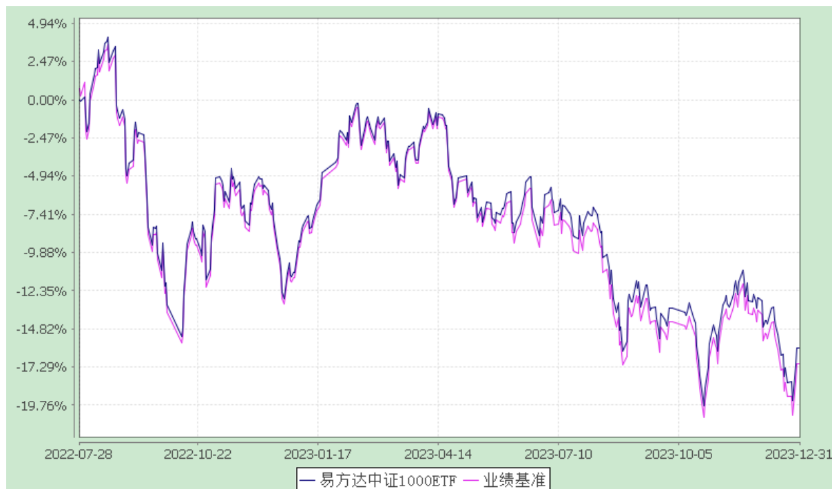
易方达中证 1000 交易型开放式指数证券投资基金 份额累计净值增长率与业绩比较基准收益率历史走势对比图 (2022 年 7 月 28 日至 2023 年 12 月 31 日)

注：1.按基金合同和招募说明书的约定，本基金的建仓期为六个月，建仓期结束时各项资产配置比例符合基金合同（第十四部分二、投资范围，三、投资策略和四、投资限制）的有关约定。