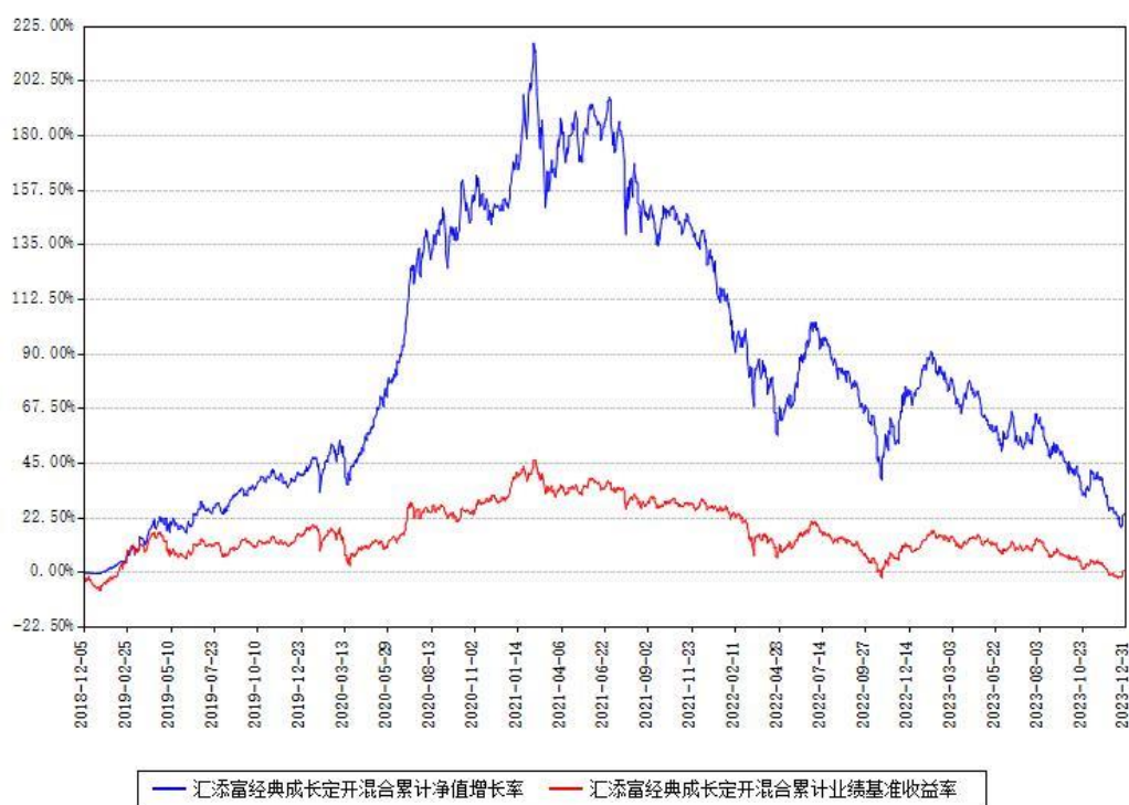
汇添富经典成长定开混合累计净值增长率与同期业绩基准收益率对比图

注：本基金建仓期为本《基金合同》生效之日（2018年12月05日）起6个月，建仓期结束时各项资产配置比例符合合同约定。