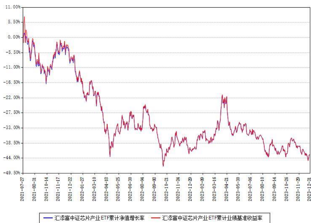
汇添富中证芯片产业ETF累计净值增长率与同期业绩比较基准收益率对比图

注：本基金建仓期为本《基金合同》生效之日（2021年07月27日）起6个月，建仓期结束时各项资产配置比例符合合同约定。