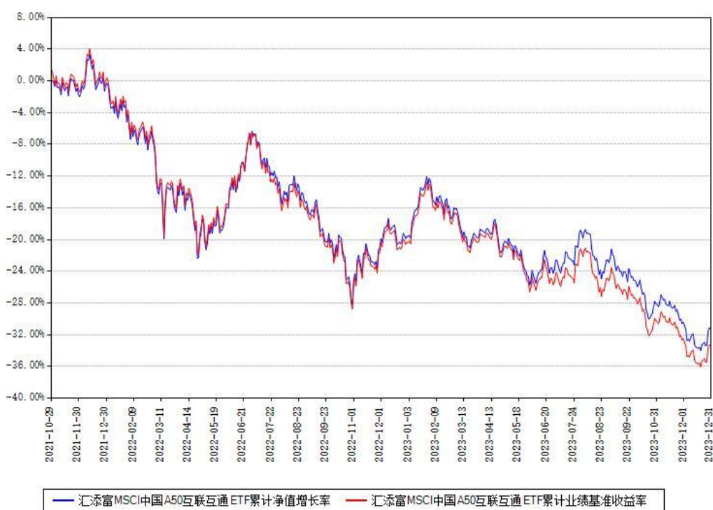
汇添富 MSCI 中国 A50 互联互通 ETF 累计净值增长率与同期业绩比较基准收益率对比图

注：本基金建仓期为本《基金合同》生效之日（2021 年 10 月 29 日）起 6 个月，建仓期结束时各项资产配置比例符合合同约定。