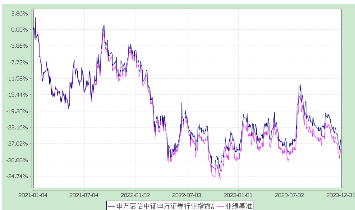
申万菱信中证申万证券行业指数 C