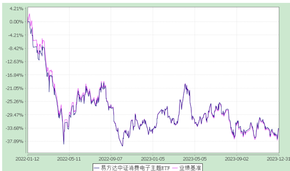
易方达中证消费电子主题交易型开放式指数证券投资基金 份额累计净值增长率与业绩比较基准收益率历史走势对比图 (2022 年 1 月 12 日至 2023 年 12 月 31 日)

注：自基金合同生效至报告期末，基金份额净值增长率为-33.85%，同期业绩比较基准收益率为-34.21%。