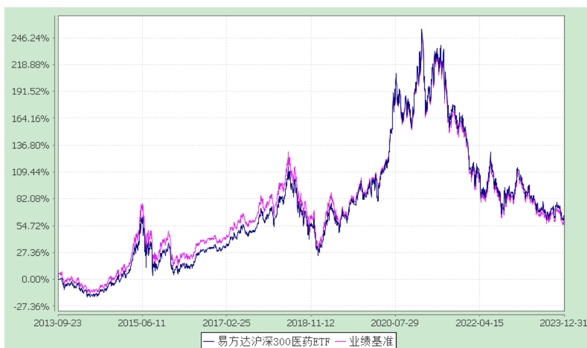
易方达沪深 300 医药卫生交易型开放式指数证券投资基金 份额累计净值增长率与业绩比较基准收益率历史走势对比图 (2013 年 9 月 23 日至 2023 年 12 月 31 日)

注：自基金合同生效至报告期末，基金份额净值增长率为 64.60%，同期业绩比较基准收益率为 60.32%。