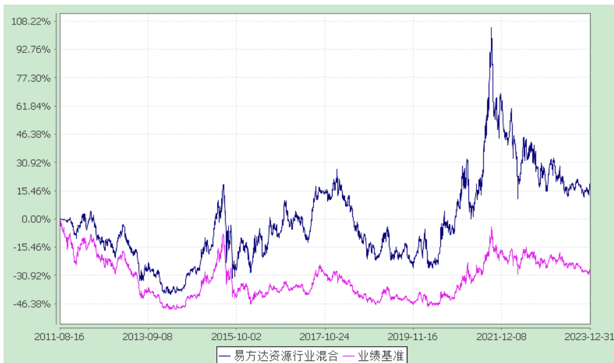
份额累计净值增长率与业绩比较基准收益率历史走势对比图 (2011 年 8 月 16 日至 2023 年 12 月 31 日)

注：自基金合同生效至报告期末，基金份额净值增长率为 18.90%，同期业绩比较基准收益率为 -27.78%。