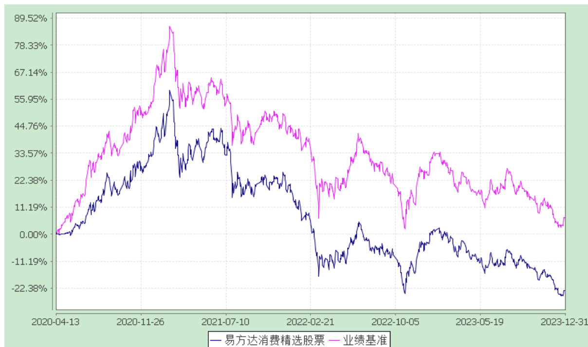
份额累计净值增长率与业绩比较基准收益率历史走势对比图 (2020 年 4 月 13 日至 2023 年 12 月 31 日)

注：自基金合同生效至报告期末，基金份额净值增长率为-23.43%，同期业绩比较基准收益率为6.76%。