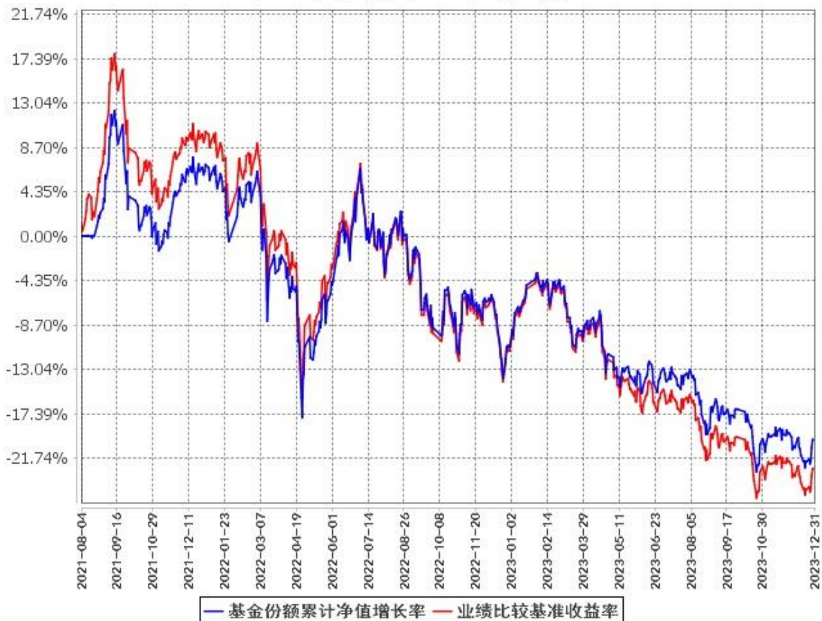
基金份额累计净值增长率与同期业绩比较基准收益率的历史走势对比图 (2021年8月4日至2023年12月31日)