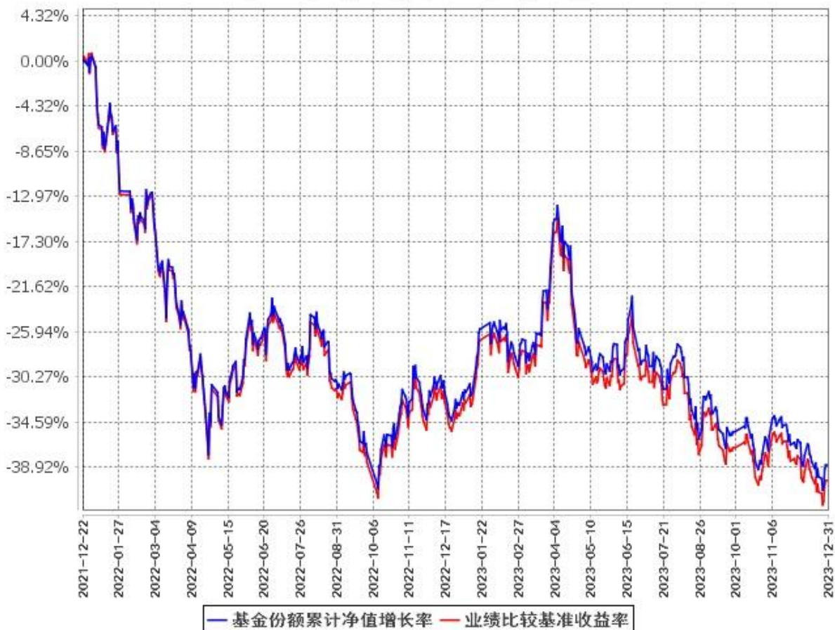
基金份额累计净值增长率与同期业绩比较基准收益率的历史走势对比图 (2021年12月22日至2023年12月31日)