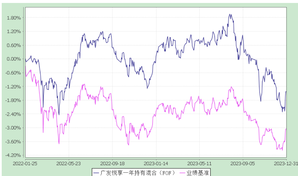
份额累计净值增长率与业绩比较基准收益率历史走势对比图 (2022 年 1 月 25 日至 2023 年 12 月 31 日)