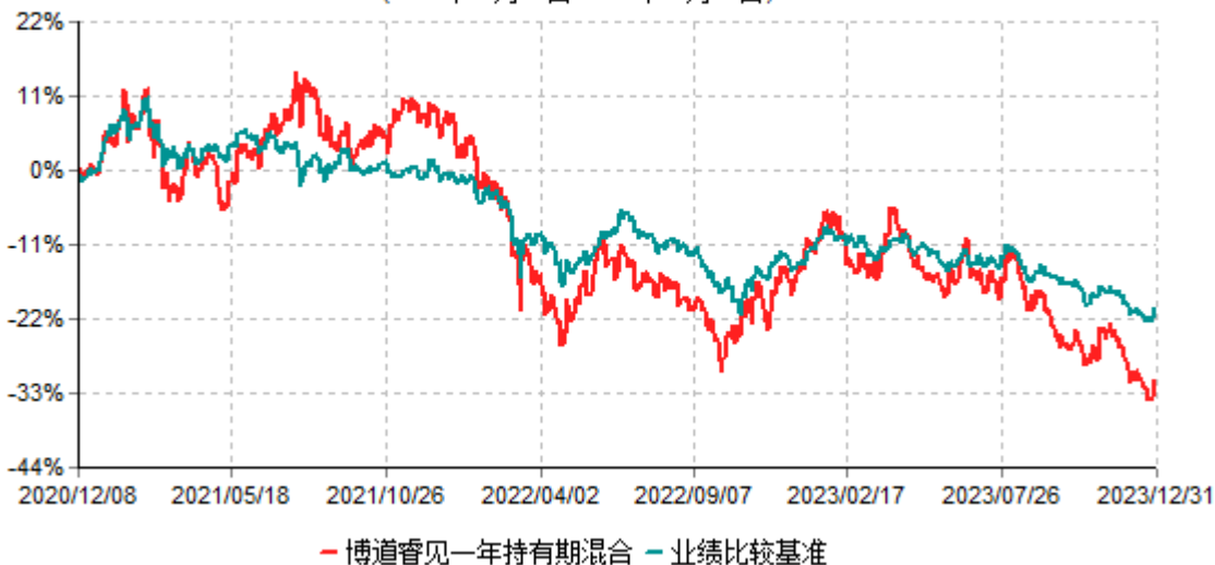
博道睿见一年持有期混合型证券投资基金累计净值增长率与业绩比较基准收益率历史走势对比图 (2020年12月08日-2023年12月31日)

注：本基金建仓期为自基金合同生效日起的6个月。截至建仓期结束，本基金各项资产配置比例符合基金合同及招募说明书有关投资比例的约定。