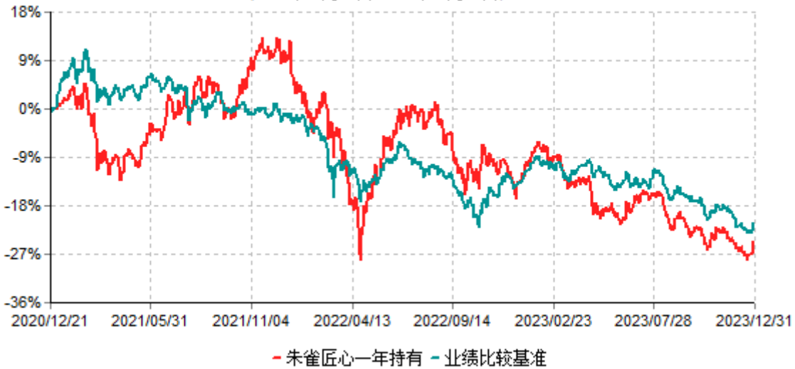
朱雀匠心一年持有期混合型证券投资基金累计净值增长率与业绩比较基准收益率历史走势对比图 (2020年12月21日-2023年12月31日)