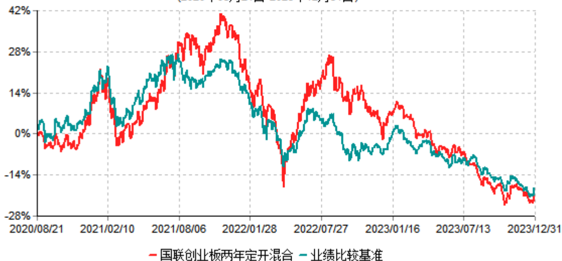
国联创业板两年定期开放混合型证券投资基金累计净值增长率与业绩比较基准收益率历史走势对比图 (2020年08月21日-2023年12月31日)

注：按基金合同和招募说明书的约定，本基金自基金合同生效日起6个月内为建仓期，建仓期结束时本基金的各项投资比例符合基金合同的有关约定。