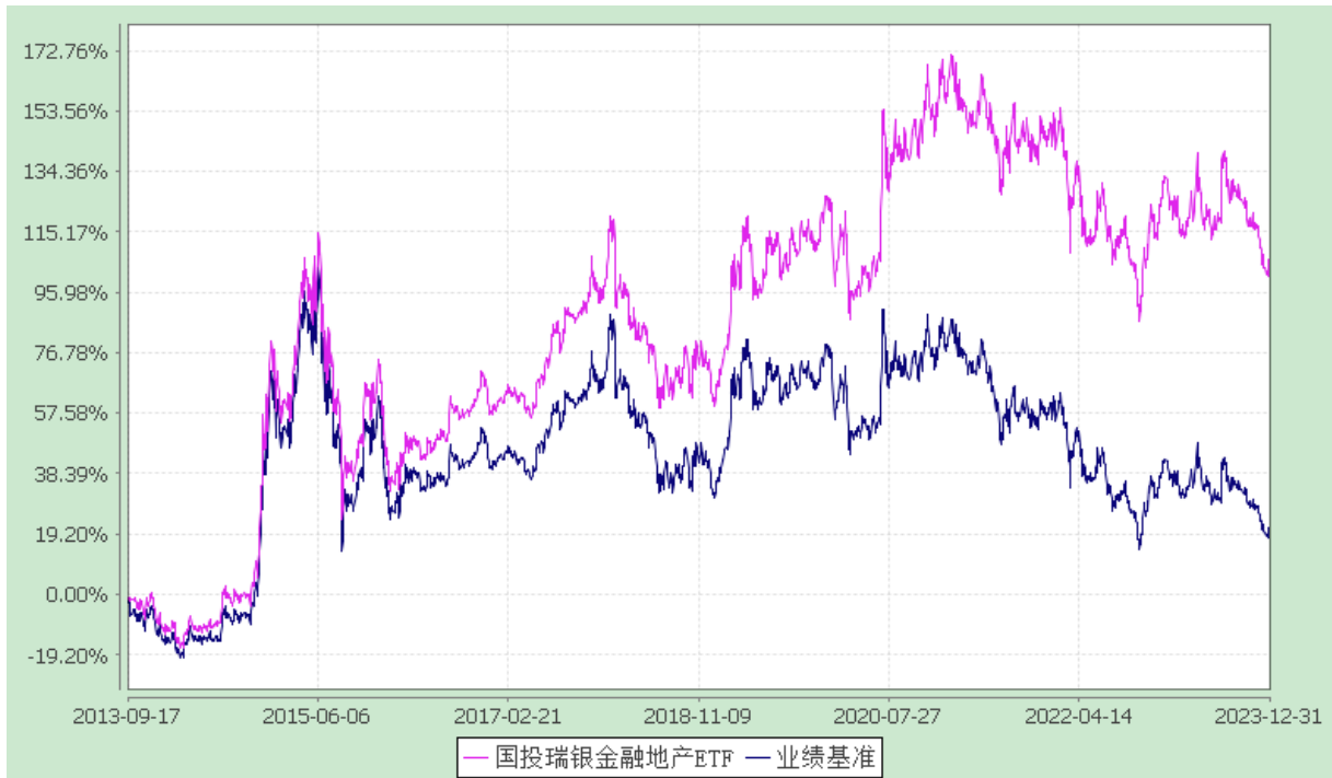
份额累计净值增长率与业绩比较基准收益率的历史走势对比图 (2013 年 9 月 17 日至 2023 年 12 月 31 日)

注：本基金建仓期为自基金合同生效日起的 3 个月。截至建仓期结束，本基金各项资产配置比例符合基金合同及招募说明书有关投资比例的约定。