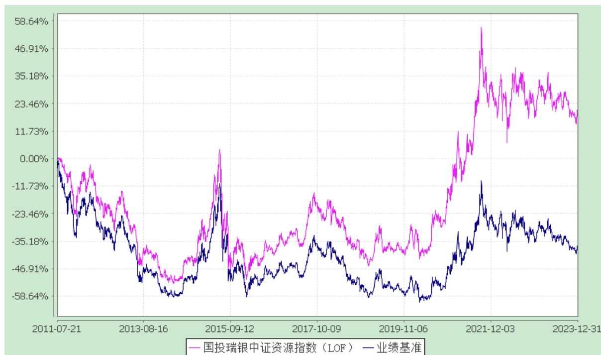
份额累计净值增长率与业绩比较基准收益率的历史走势对比图 (2011 年 7 月 21 日至 2023 年 12 月 31 日)

注：本基金建仓期为自基金合同生效日起的 6 个月。截至建仓期结束，本基金各项资产配置比例符合基金合同及招募说明书有关投资比例的约定。