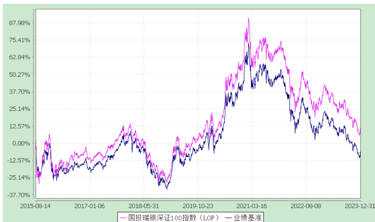
国投瑞银瑞福深证 100 指数证券投资基金（LOF） 份额累计净值增长率与业绩比较基准收益率的历史走势对比图 (2015 年 8 月 14 日至 2023 年 12 月 31 日)

注：本基金建仓期为自基金合同生效日起的 6 个月。截至建仓期结束，本基金各项资产配置比例符合基金合同及招募说明书有关投资比例的约定。