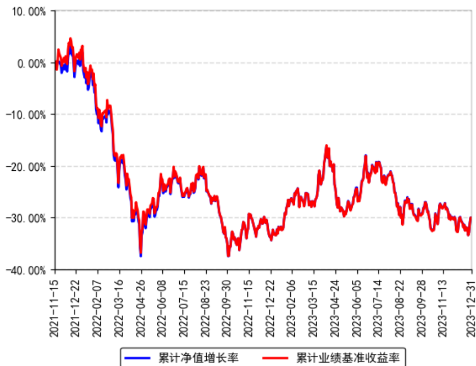
南方中证物联网主题ETF累计净值增长率与同期业绩比较基准收益率的历史走势对比图