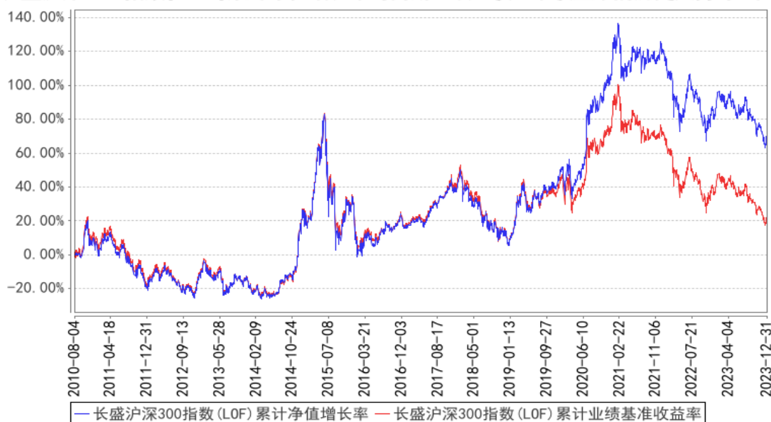
长盛沪深300指数(LOF)累计净值增长率与同期业绩比较基准收益率的历史走势对比图

注：按照本基金合同规定，本基金管理人应当自基金合同生效之日起三个月内使基金的投资组合比例符合基金合同的约定。本报告期内，本基金的各项资产配置比例符合基金合同约定。