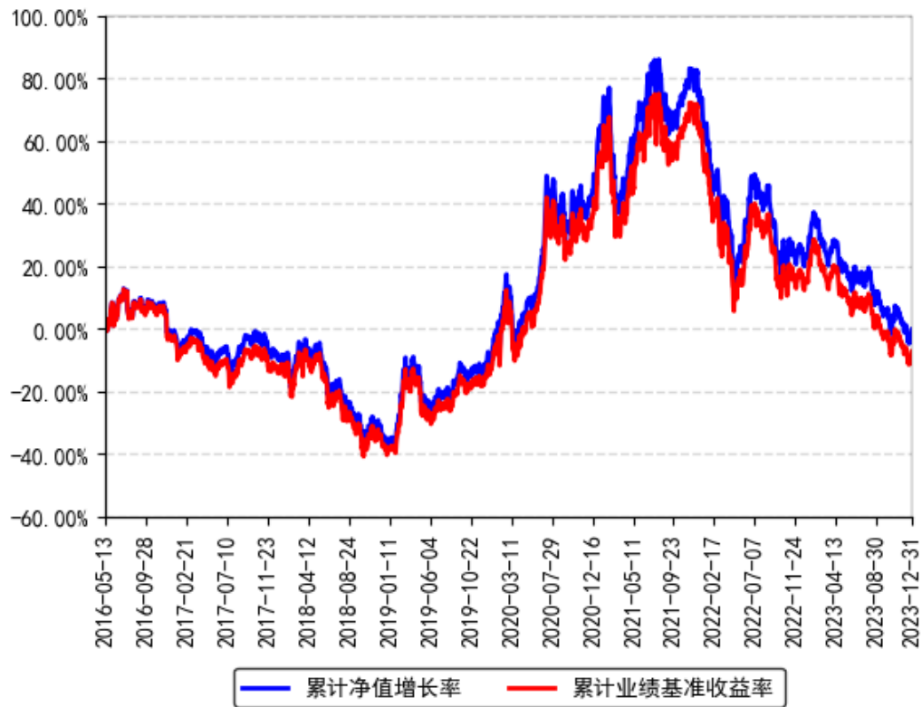
南方创业板ETF累计净值增长率与同期业绩比较基准收益率的历史走势对比图