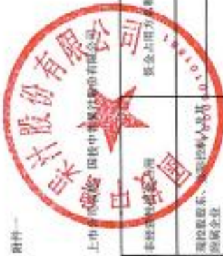
2023年度非经营性资金占用及其他关联资金往来情况汇总表