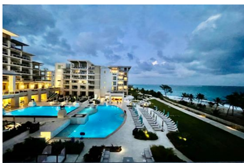
巴巴多斯山姆罗德酒店项目

(5) 亚德公司工程承包业务实现营业收入 20.5 亿元，较去年同期减少 22%，本年主要执行以前年度的项目，按进度确认收入同比减少。