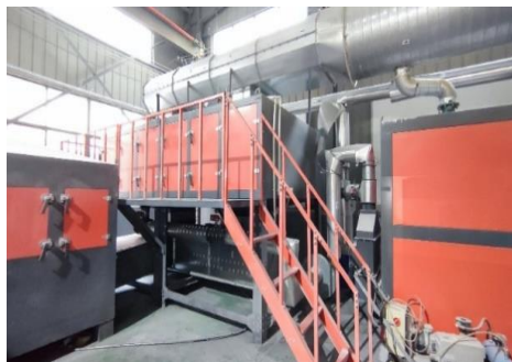
复合材料环保设备