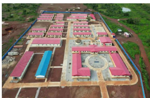
科特迪瓦旱港建设项目营地