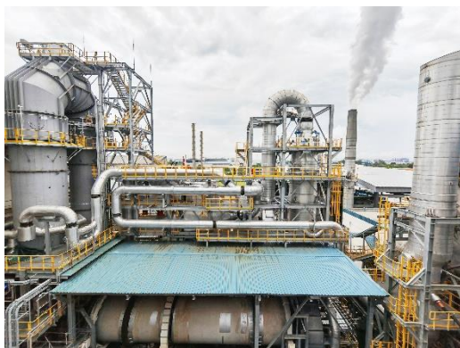
ECO 新加坡炭黑焚烧项目

公司环境科技业务实现营业收入 5.34 亿元，较上年同期减少 18.56%。主要在施项目包括湛江巴斯夫处理项目、山东裕龙岛炼化项目、海南洋浦港危险废物处理中心项目、广西华谊废液焚烧项目、吉林美思德项目、新加坡 ECO 焚烧项目等。