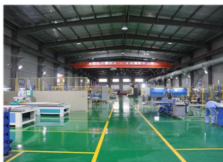
复合材料生产车间