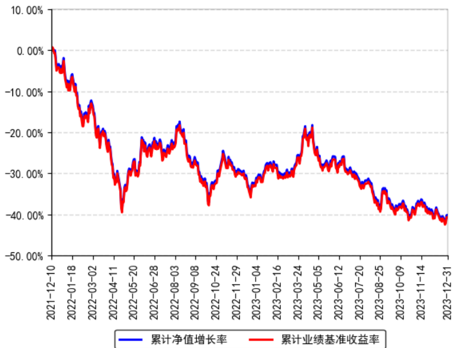
南方上证科创板50成份ETF累计净值增长率与同期业绩比较基准收益率的历史走势对比图