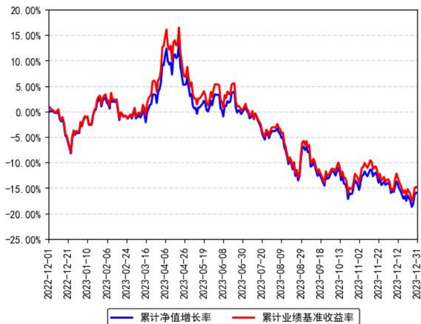
南方上证科创板50成份增强策略ETF累计净值增长率与同期业绩比较基准收益率的历史走势对比图