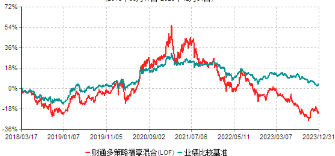
财通多策略福享混合型证券投资基金（LOF）累计净值增长率与业绩比较基准收益率历史走势对比图 (2018年03月17日-2023年12月31日)

注：(1)本基金合同生效日为2016年9月18日，转型日期为2018年3月17日； (2)本基金建仓期为基金合同生效起6个月，截至报告期末和基金建仓期末，基金的资产配置符合基金契约的相关要求。