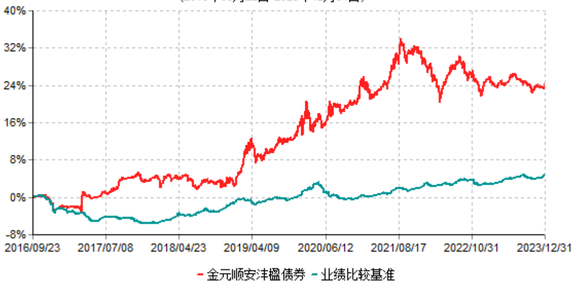
金元顺安沅楹债券型证券投资基金累计净值增长率与业绩比较基准收益率历史走势对比图 (2016年09月22日-2023年12月31日)