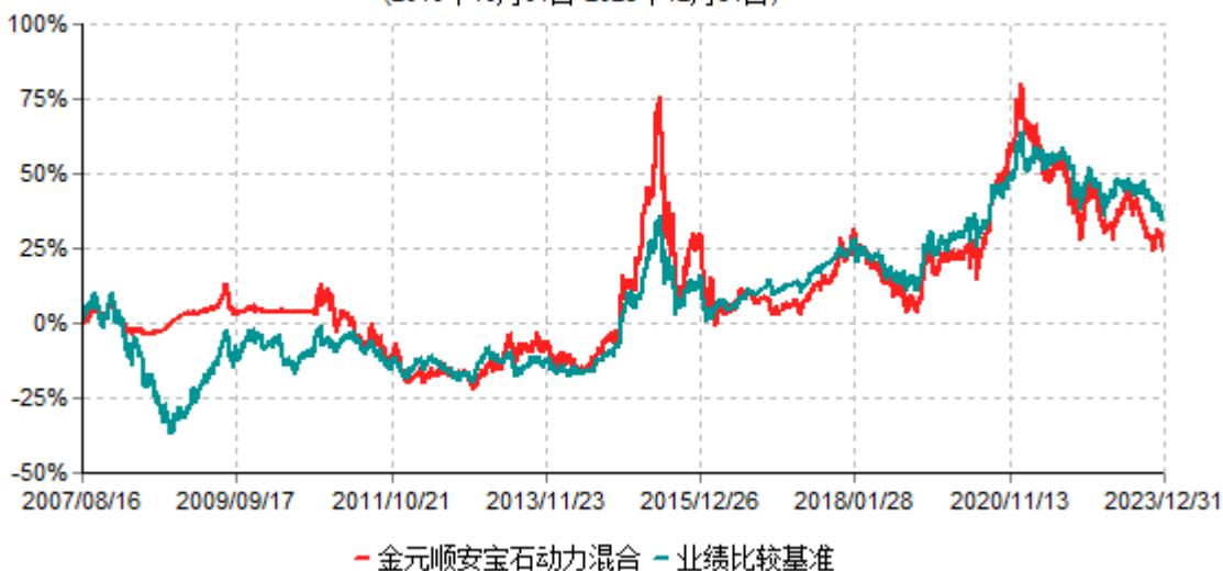
金元顺安宝石动力混合型证券投资基金累计净值增长率与业绩比较基准收益率历史走势对比图 (2010年10月01日-2023年12月31日)