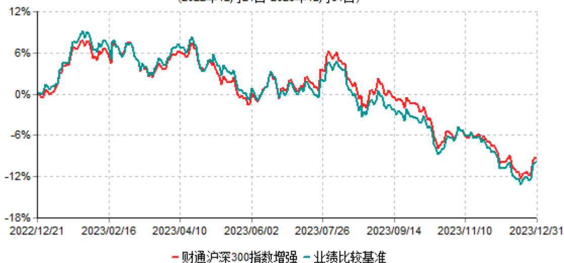
财通沪深300指数增强型证券投资基金累计净值增长率与业绩比较基准收益率历史走势对比图 (2022年12月21日-2023年12月31日)

注：(1)财通量化价值优选灵活配置混合型证券投资基金基金合同生效日为2019年1月30日，本基金自2022年12月21日起转型为财通沪深300指数增强型证券投资基金； (2)本基金建仓期是合同生效日起6个月，截至建仓期末和本报告期末，本基金的资产配置符合基金契约的相关要求。