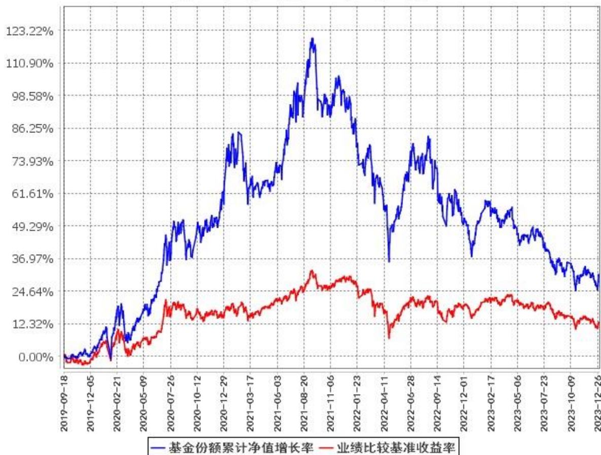
基金份额累计净值增长率与同期业绩比较基准收益率的历史走势对比图 (2019年9月18日至2023年12月31日)