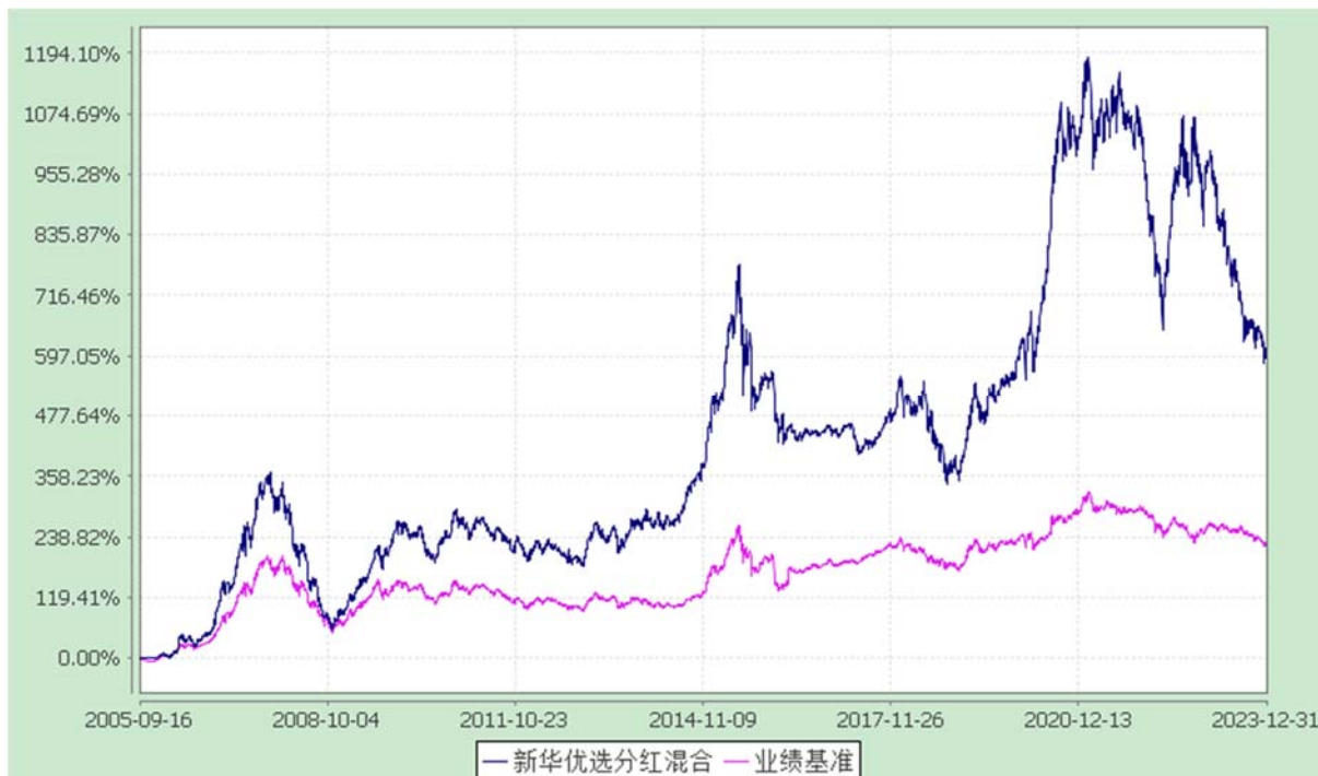
自基金合同生效以来份额累计净值增长率与业绩比较基准收益率的历史走势对比图 (2005 年 9 月 16 日至 2023 年 12 月 31 日)

注：本基金于 2005 年 9 月 16 日基金合同生效，报告期内本基金的各项资产配置比例符合基金合同的有关约定。